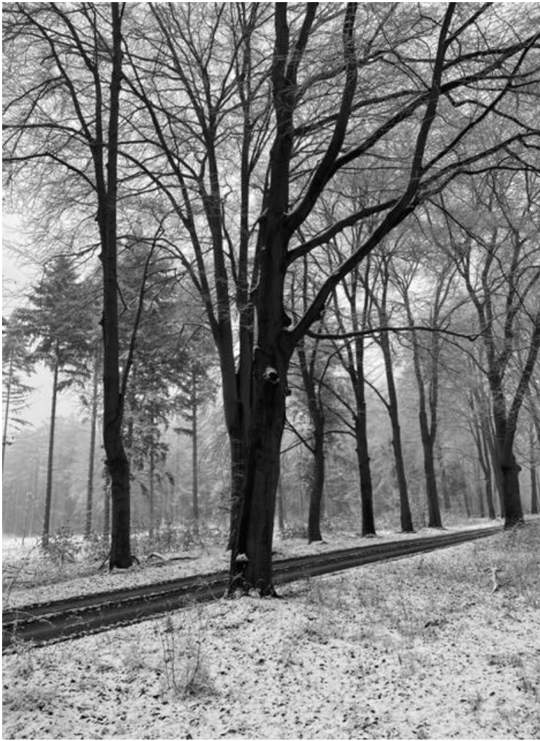
Diepenveen 8 maart 2023