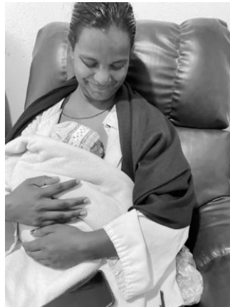
Eerste beeld Scheer Memorial Hospital, Nepal